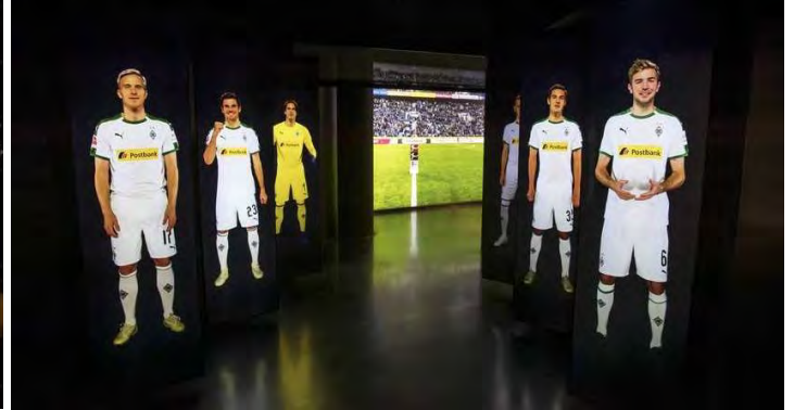
Der Borussia Park, Herzstück der Area of Sports mit der Galerie der Nationalspieler

Ihre Tagesetappe führt Sie als Rundtour zunächst über den Rhein durch Neuss und weiter entlang des Nordkanals, der sich schnurgerade durch das Kaarster Stadtgebiet zieht, Richtung Mönchengladbach. Am Kaarster See sollten Sie bei sommerlichen Temperaturen eine Rast einzulegen. Mit Badesachen im Gepäck können Sie sich hier herrlich erfrischen und vor der Weiterfahrt am Strand ein Sonnenbad nehmen. In Mönchengladbach angekommen dürfen hartgesottene Fohlenfans nicht einen Abstecher nach Eicken versäumen. Dieser Extratörn wird mit dem Besuch des Bökelberg-Denkmal und einer Bronzeskulptur zu Ehren der lebenden Gladbacher Legenden Günter Netzer, Berti Vogts und Herbert „Hacki“ Wimmer belohnt. Nur wenige Schritte von den bronzenen Fußballhelden entfernt befindet sich in der Fußgängerzone ein 1,80 Meter hoher und etwa 10 Tonnen schwerer Granit-Fußball, der anlässlich des 110-jährigen Vereinsjubiläums in Eicken aufgestellt wurde. Den Sockel zieren die Gravuren der großen Erfolge der Fohlenelf.